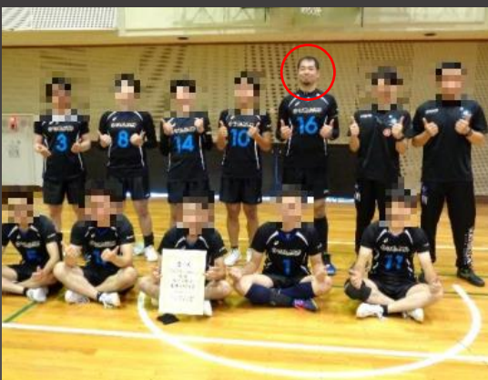
※今年の全日本9人制総合男子女子選手権大会 長野県予選会で優勝しました。